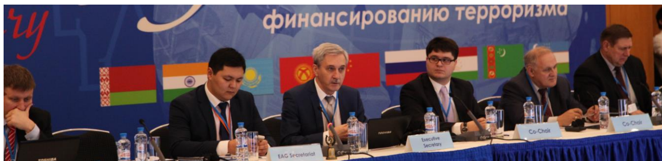
Совместный семинар ЕАГ/АТЦ СНГ

В ходе 23-й Пленарной недели состоялся совместный семинар ЕАГ/АТЦ СНГ по укреплению взаимодействия между подразделениями финансовой разведки и правоохранительными органами при расследовании преступлений, связанных с финансированием терроризма. По итогам семинара был принят итоговый документ.