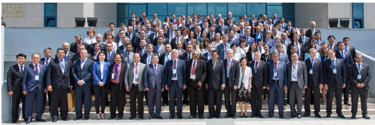
22-е Пленарное заседание и заседания Рабочих групп ЕАГ

Пленарное заседание заслушало дополнительную информацию о ходе реализации программы добровольного соблюдения налогового законодательства в Казахстане.