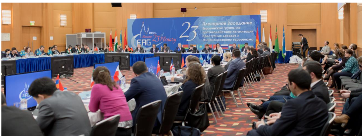
23-е Пленарное заседание и заседания Рабочих групп ЕАГ

Пленарное заседание рассмотрело вопросы, связанные с деятельностью ИГИЛ и призвало государства-члены к активизации усилий в борьбе с финансированием террористической организации ИГИЛ, а также скорейшей имплементации соответствующих Резолюций Совета Безопасности ООН.