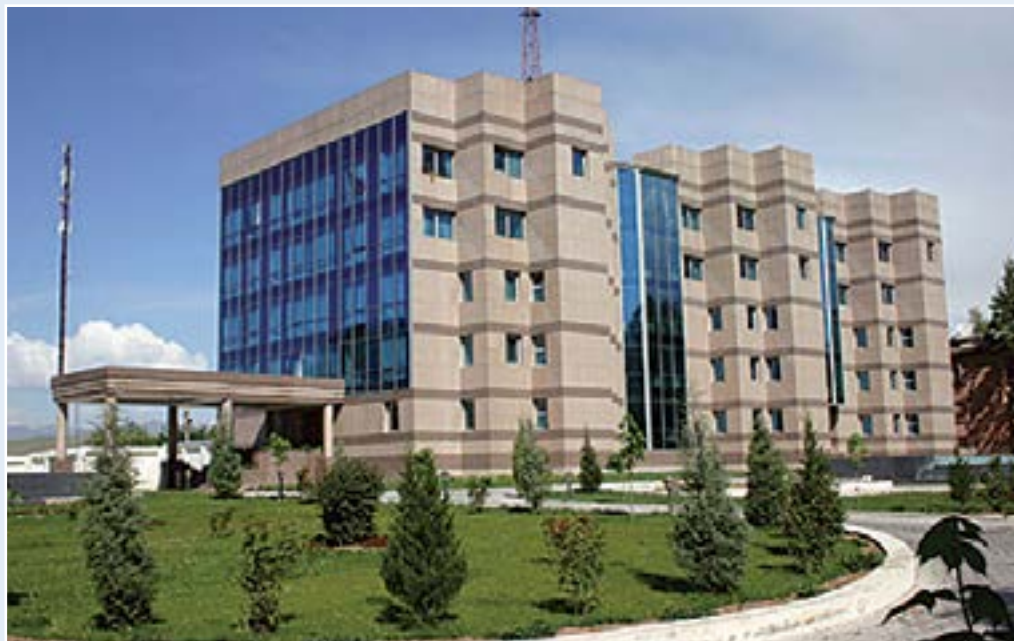
Национальный банк Таджикистана Административное здание