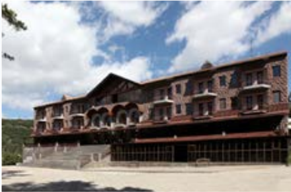
Учебный центр Центрального банка Республики Армения (г. Цахкадзор)