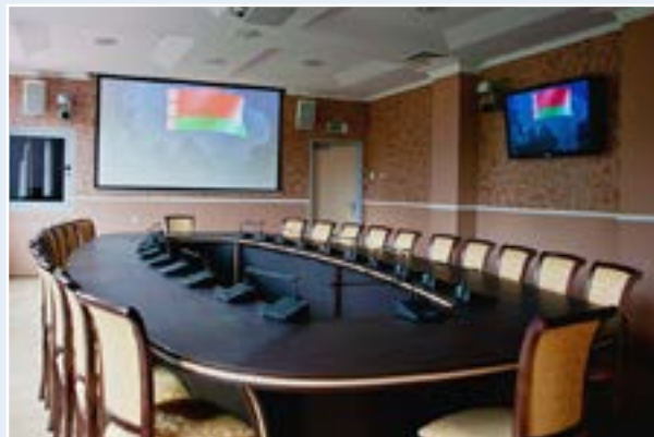
Зал для переговоров

К услугам любителей спорта универсальный спортивный зал, отвечающий современным европейским стандартам и позволяющий заниматься теннисом, футболом, волейболом, баскетболом и т.д.; тренажерный зал, бильярд, пункт проката спортивного инвентаря, русская баня и финская сауна.