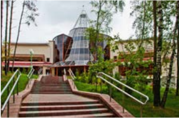
Учебный центр Национального банка Республики Беларусь (д. Раубичи)