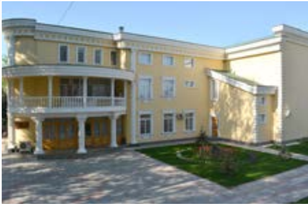
Учебный центр Национального банка Таджикистана (г. Гулистон)