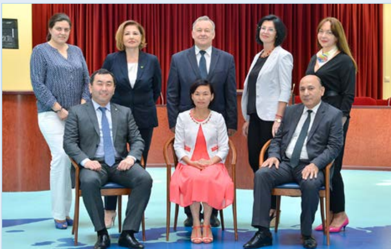
Участники 24-го заседания Координационного совета по вопросам профессионального обучения персонала центральных (национальных) банков 23-24 августа 2016 года, г. Тула