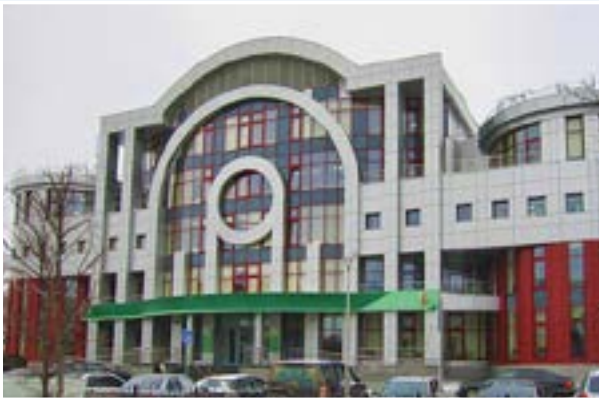
Корпоративный университет Банка России