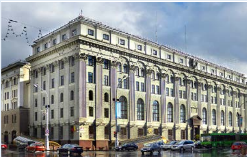
Национальный банк Республики Беларусь Административное здание