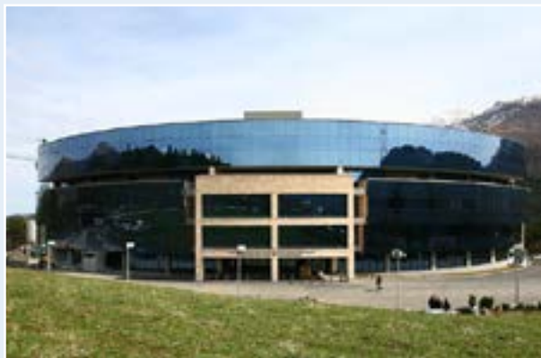
Учебно-исследовательский центр Центрального банка Республики Армения (г. Дилижан)