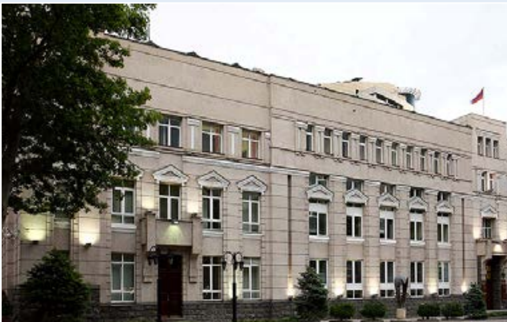
Центральный банк Республики Армения Административное здание