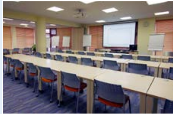
Аудитория для проведения семинаров

Корпоративный университет Банка России — многофункциональный учебный комплекс, оснащение которого позволяет проводить обучение в любом необходимом формате.