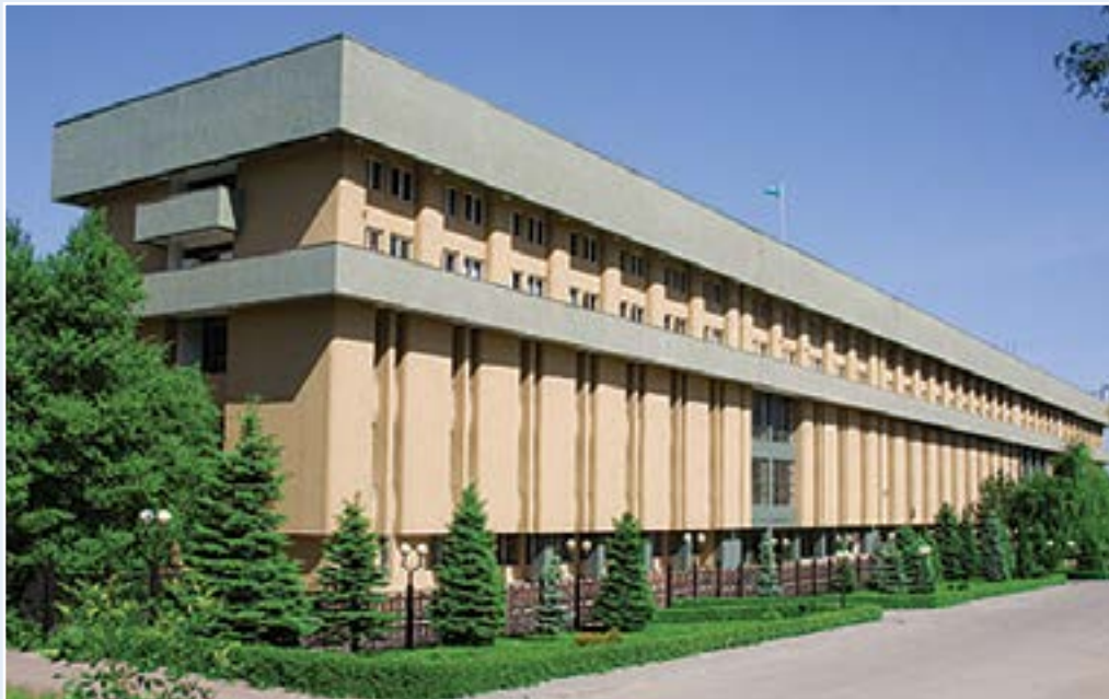
Национальный Банк Республики Казахстан Административное здание