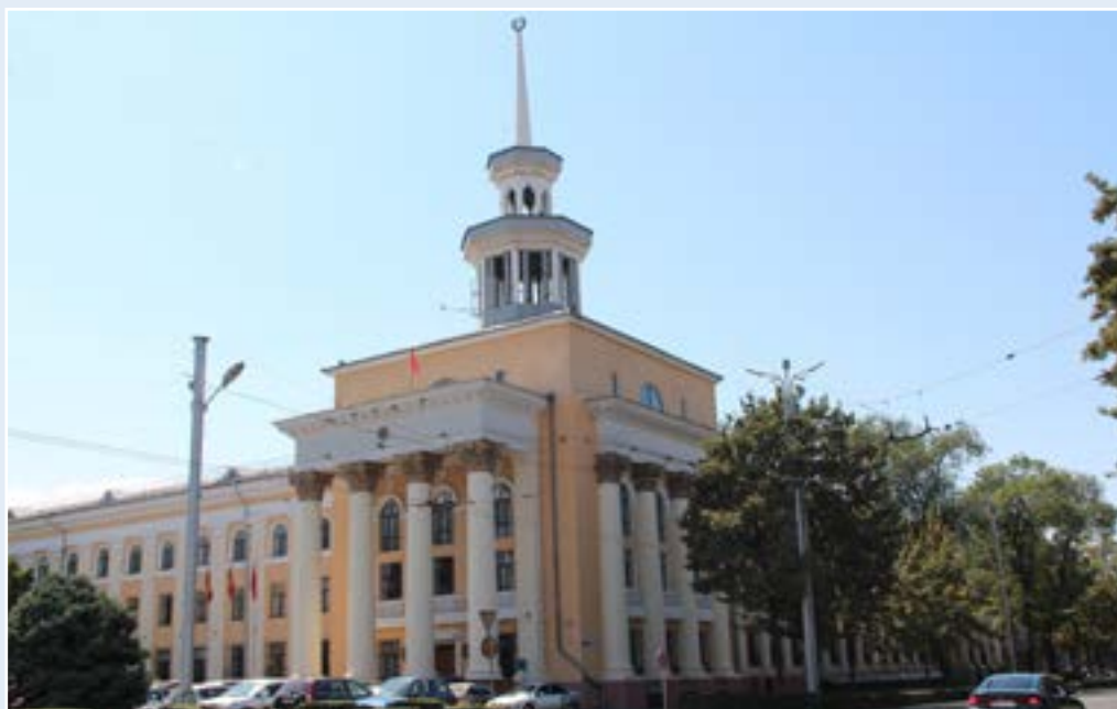
Национальный банк Кыргызской Республики Административное здание