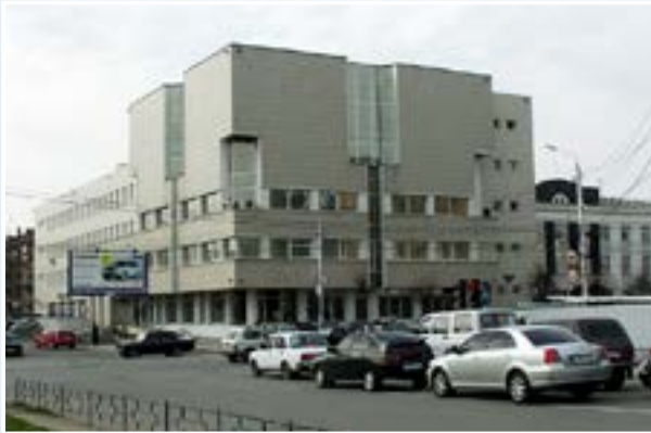
Межрегиональный учебный центр Банка России (г. Тула)