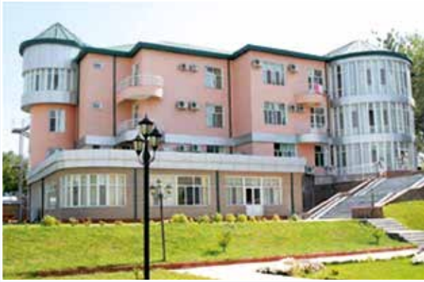
Учебно-оздоровительный центр Национального банка Таджикистана (г.Кайраккум)