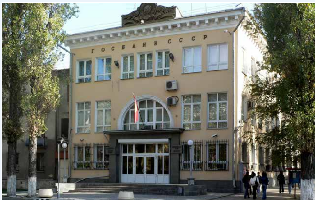
Национальный банк Кыргызской Республики Административное здание