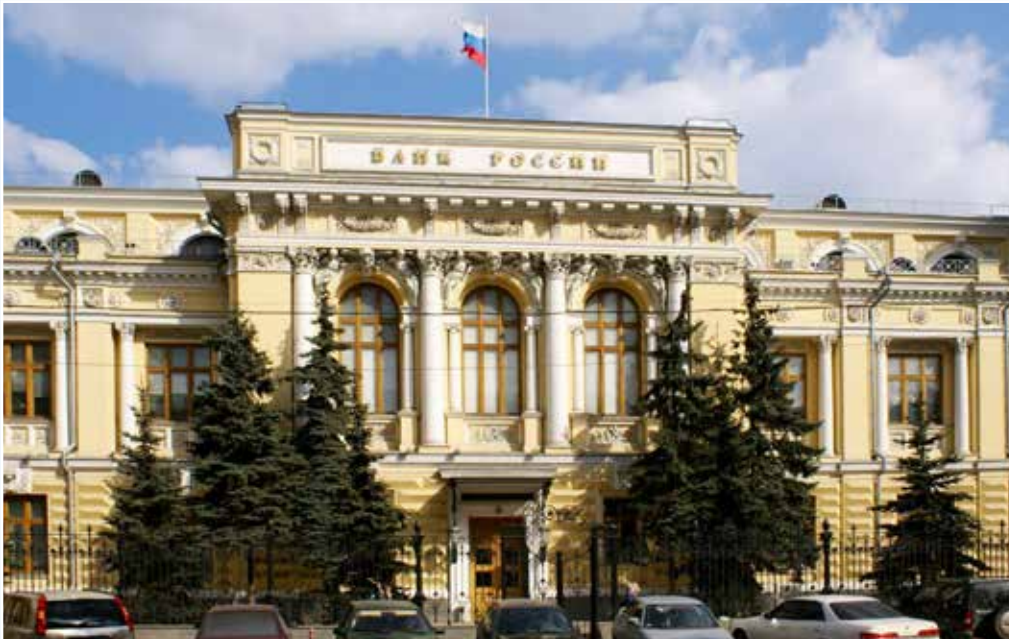
Центральный банк Российской Федерации Административное здание