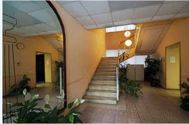
Холл учебно-гостиничного корпуса

Центр подготовки персонала является ведущим учебным центром в системе повышения квалификации персонала Банка России. Здесь проводятся учебные мероприятия для руководящих работников и специалистов центрального аппарата и территориальных учреждений Банка России, в том числе с участием представителей зарубежных банков и международных организаций.