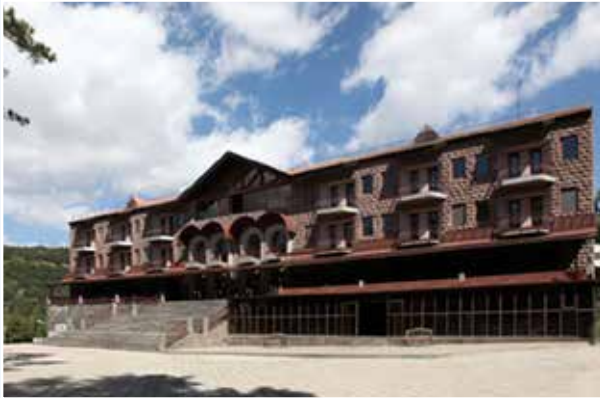
Учебный центр Центрального банка Республики Армения (г. Цахкадзор)