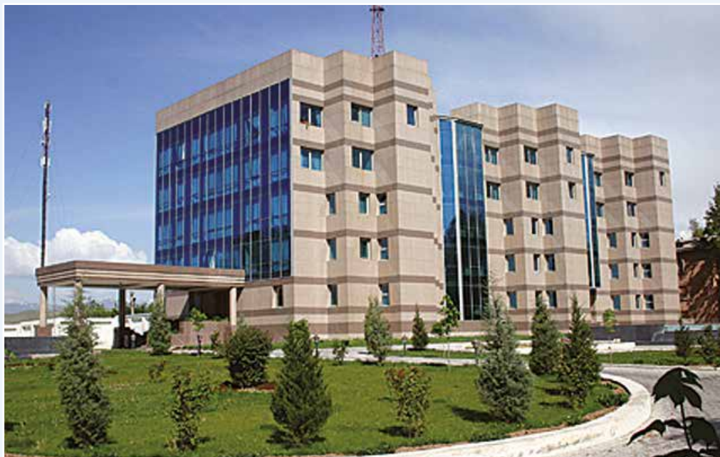
Национальный банк Таджикистана Административное здание