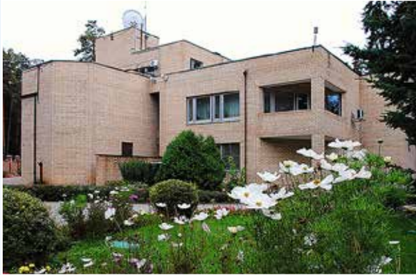
Центр подготовки персонала Банка России