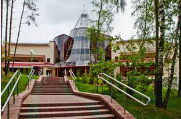
Учебный центр Национального банка Республики Беларусь (д. Раубичи)