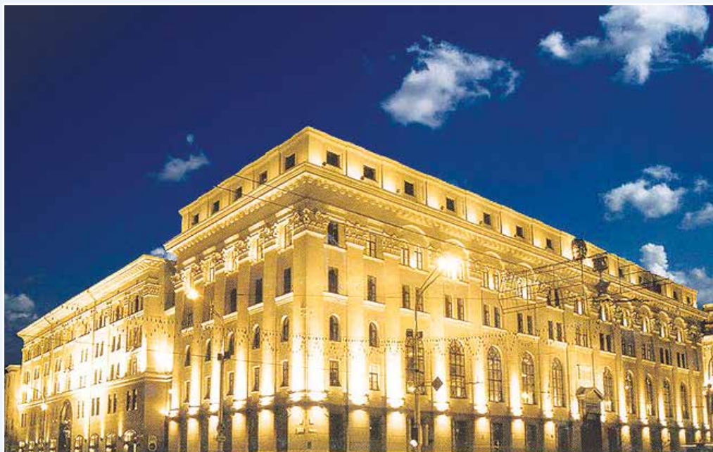
Национальный банк Республики Беларусь Административное здание