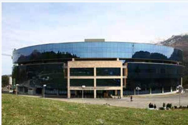
Учебно-исследовательский центр Центрального банка Республики Армения (г. Дилижан)