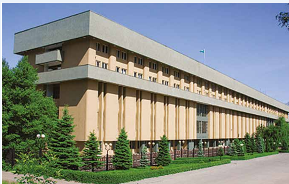
Национальный Банк Республики Казахстан Административное здание