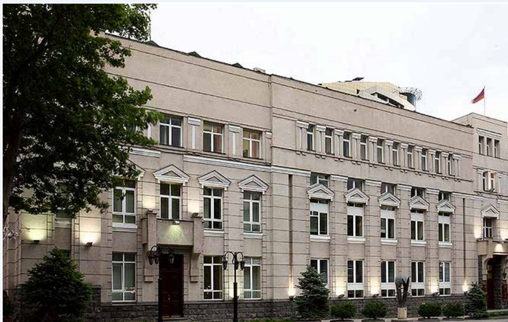
Центральный банк Республики Армения Административное здание