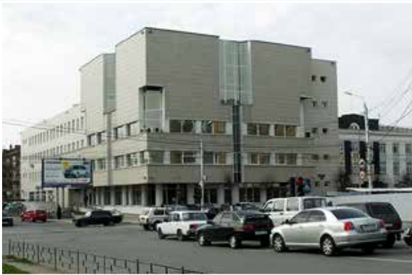
Межрегиональный учебный центр Банка России (г. Тула)