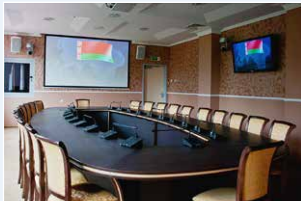
Зал для переговоров

ных правовой информации «КонсультантПлюс», Интернет.