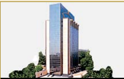
Центральный банк Республики Узбекистан Административное здание

100001, Узбекистан, г. Ташкент, пр. Узбекистанский, 6 Факс: (998 71) 133-63-98