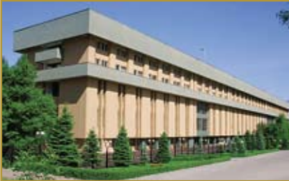
Национальный банк Республики Казахстан Административное здание

Факс: +7 (7272) 70-47-03, 70-47-99, 70-48-15