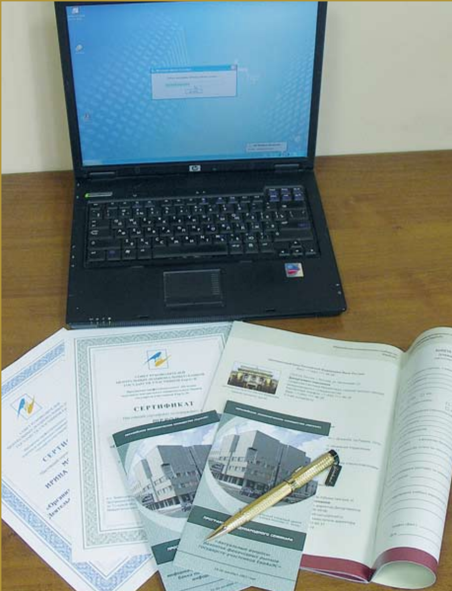
ГРАФИК ПРОВЕДЕНИЯ СЕМИНАРОВ