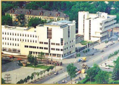
Межрегиональный учебный центр Банка России (г. Тула)