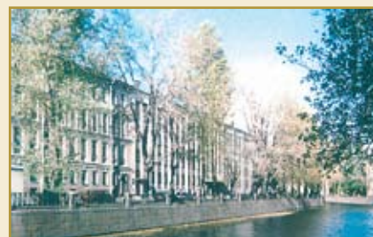
Санкт-Петербургская банковская школа (колледж) Банка России