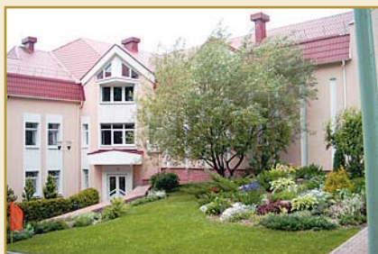
Учебный центр Национального банка Республики Беларусь (д. Раубичи)