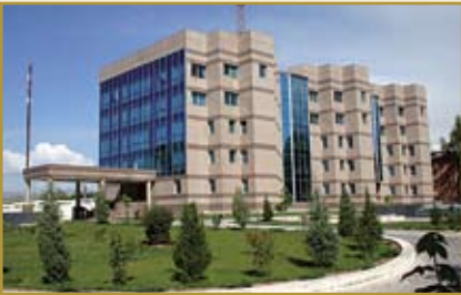
Национальный банк Таджикистана Административное здание

734003, Республика Таджикистан, г. Душанбе, пр. Рудаки, 107а Факс: (992 44) 600-32-35