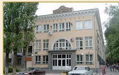
Национальный банк Кыргызской Республики Административное здание