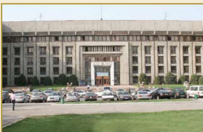
Агентство Республики Казахстан по регулированию и надзору финансового рынка и финансовых организаций Административное здание