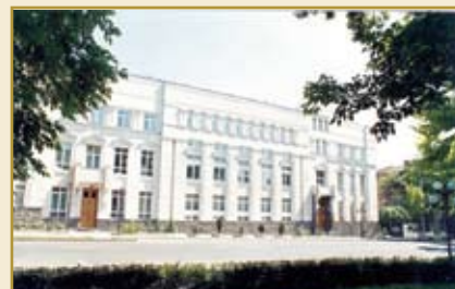
Центральный банк Республики Армения Административное здание