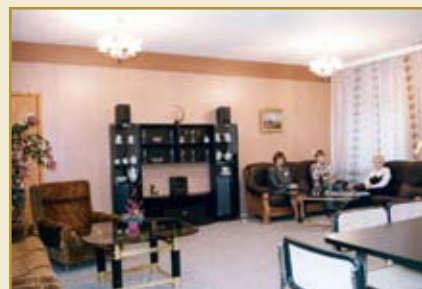
Комната для преподавателей