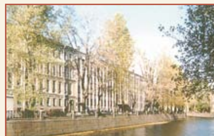
Санкт-Петербургская банковская школа (колледж) Банка России