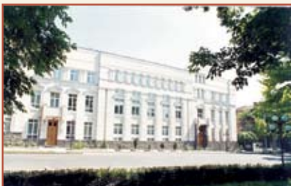
Центральный банк Республики Армения Административное здание

(0010, Республика Армения, г. Ереван, ул. Вазгена Саргсяна, 6)