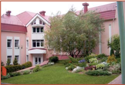
Учебный центр Национального банка Республики Беларусь (д. Раубичи)