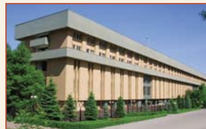
Национальный банк Республики Казахстан Административное здание