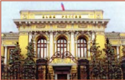
Центральный банк Российской Федерации Административное здание

(107016, Россия, г. Москва, ул. Неглинная, 12)