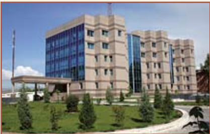
Национальный банк Таджикистана Административное здание

(734003, Республика Таджикистан, г. Душанбе, пр.Рудаки, 107а)