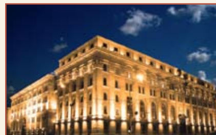
Национальный банк Республики Беларусь Административное здание