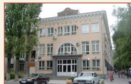
Национальный банк Кыргызской Республики Административное здание