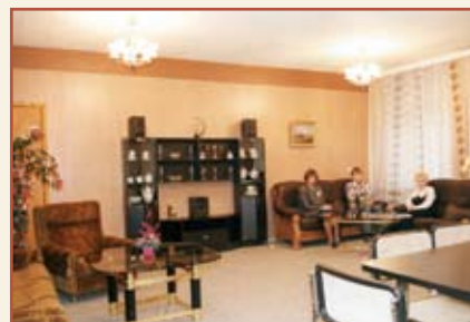
Комната для преподавателей