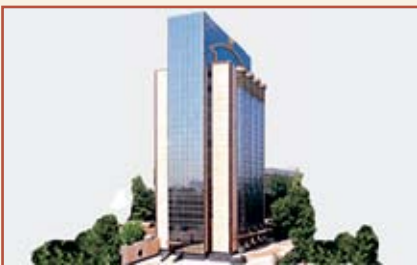
Центральный банк Республики Узбекистан Административное здание

(100001, Узбекистан, г.Ташкент, пр.Узбекистанский, 6)