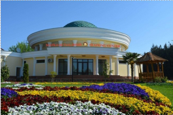
Учебный центр Национального банка Таджикистана (г. Гулистон)

Учебный центр Национального банка Таджикистана создан с целью проведения курсов повышения квалификации для работников банковской системы. При строительстве Учебного центра были учтены все особенности данного направления и созданы необходимые условия для встречи и размещения гостей и проведения различных мероприятий на должном уровне.