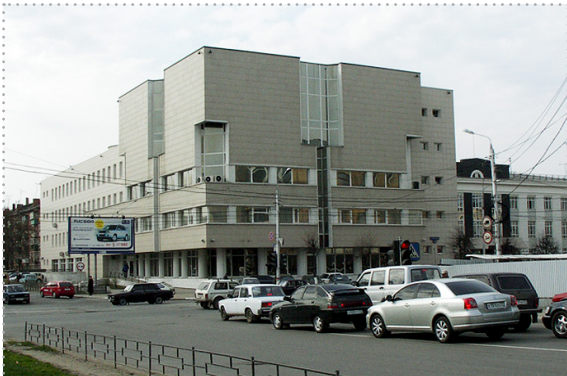
Межрегиональный учебный центр, г. Тула Университета Банка России

В соответствии с многосторонним Соглашением о сотрудничестве в области обучения персонала Межрегиональный учебный центр, г. Тула Университета Банка России является основной площадкой, где проводятся международные учебные мероприятия для представителей центральных (национальных) банков – участников Евразийского совета центральных (национальных) банков, стран СНГ, экспертов зарубежных банков и международных финансовых организаций.