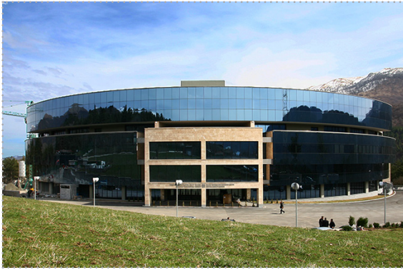
Учебно-исследовательский центр Центрального банка Республики Армения (г. Дилижан)

Учебно-исследовательский центр Центрального банка Республики Армения находится в городе Дилижан, который является горноклиматическим и бальнеологическим курортом, расположенным на высоте 1250-1500 м над уровнем моря в 110 км от Еревана.