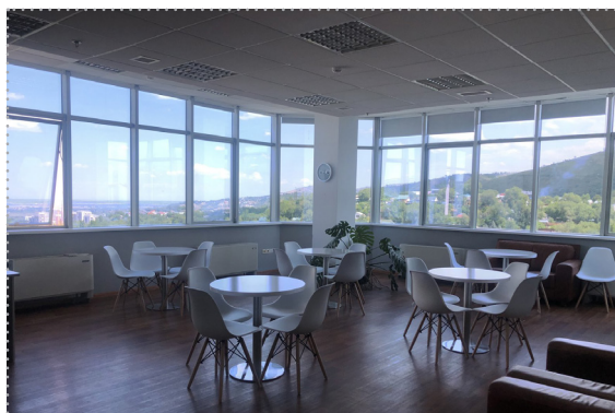
Зона для проведения кофе-брейков

АО «Учебный Центр Национального Банка Республики Казахстан» образован 27 апреля 2017 года и является дочерней организацией Национального Банка Республики Казахстан.