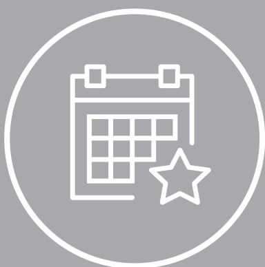
График проведения семинаров