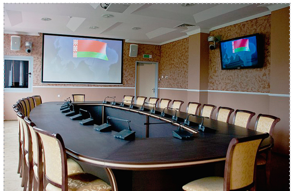
Зал для переговоров

Учебный центр образован 1 апреля 1997 года как структурное подразделение Национального банка Республики Беларусь для организации и проведения мероприятий по обучению руководителей и специалистов банковской системы Республики Беларусь по основным направлениям банковской деятельности, а также в области информационных технологий.