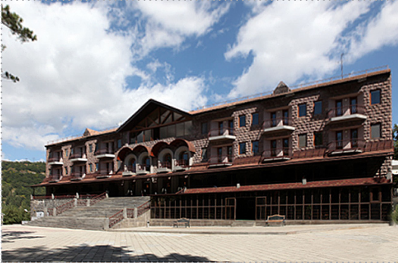
Учебный центр Центрального банка Республики Армения (г. Цахкадзор)

Учебный центр является структурным подразделением Центрального банка Республики Армения.