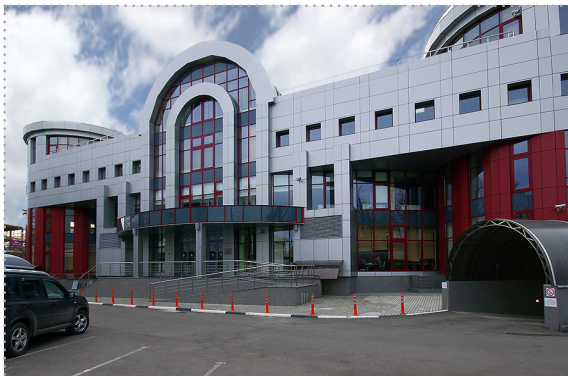
Университет Банка России