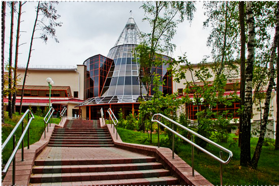
Учебный центр Национального банка Республики Беларусь (д. Раубичи)