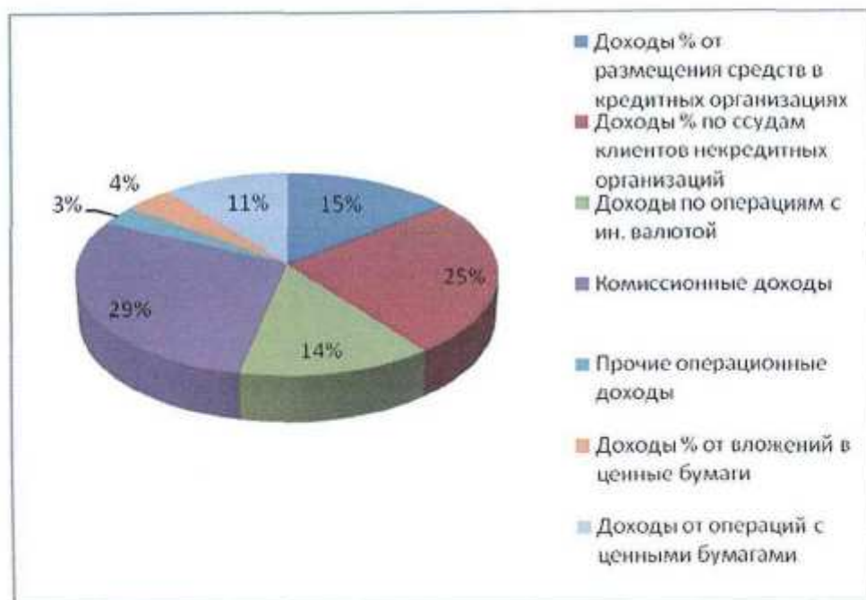
Диаграмма 1. Структура доходов Банка в 2009г.

В целом, изменения в структуре баланса являются результатом реализации банком стратегии, определённой на указанный отчётный период и соответствуют текущей экономической конъюнктуре.