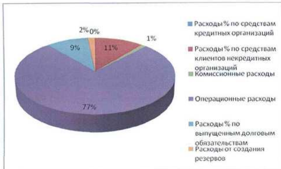
Диаграмма 2. Структура расходов Банка в 2009г.