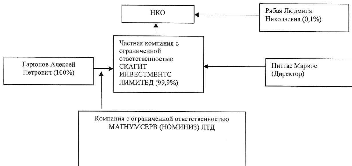
Рисунок 1 – Характер взаимосвязей между учредителями (участниками).

В соответствии со ст. 4 Федерального закона «О банках и банковской деятельности» участники НКО составляют группу лиц, имеющую возможность оказывать прямое влияние на решения, принимаемые органами управления НКО. Характер взаимосвязей между учредителями (участниками) НКО представлен схематично на рисунке 1.